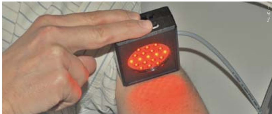
Der entwickelte Prototyp einer kostengünstigen Lichtquelle für die Anwendung der photodynamischen Therapie in der Dermatologie.

Trotz anders lautender Werbung existiert derzeit keine Licht-Epilationmethode, die alle Haare dauerhaft entfernt. Eine effiziente und sichere PDT für die «ultimate» Epilation hat deshalb ein unglaubliches Marktpotenzial. Wichtig ist aber, dem Anwender PDT als komplettes System anzubieten.